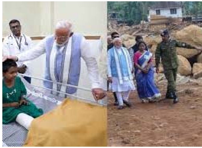
క్షేత్రాల్లో మోడీ పరామర్శ పరియల్ సర్వే ద్వారా విలయ ప్రాంత వీక్షణం సీఎం పినరయతో కలసి సమీక్ష అన్ని విధాలుగా ఆండగా ఉంటామని ప్రధాని హామీ

లేదని నేను హామీ ఇస్తున్నాను. వారికి మేము ఆండగా ఉన్నాం. కేంద్ర ప్రభుత్వం వారికి సాయం చేస్తోంది తెలిపారు. వయనాడ్ కొండచరియల ప్రకృతి విపత్తును ప్రధాని మోడీ కనిపారం హైలికాష్టర్ ద్వారా వీక్షించారు. ఢిల్లీ నుంచి విమానంలో కేరళకు బయలుదేరిన ప్రధాని.. ఉదయం 11 గంటలకు కన్నూర్ ఎయిర్ పోర్ట్ కు చేరుకున్నారు. ఆయన్ని కేరళ ముఖ్యమంత్రి పినరయ విజయన్ రివీవ్ చేసుకున్నారు. అక్కడ నుంచి ఓ ప్రత్యేక విమానంలో వయనాడ్ బయలుదేరారు. కొండచరియలు సంభవించిన చూరల్ మలా, మండక్కై ప్రాంతాలలో విరియల్ సర్వే నిర్వహించారు. రెన్యూ ఆబర్షన్, సహాయక చర్యలు, పునరావాస కేంద్రాల గురించి అధికారులను ప్రధాని మోడీ అడిగి తెలుసుకున్నారు. అనంతరం బాధితులను కలుసుకోని మాట్లాడారు. వయనాడ్ ప్రాంతంలో ప్రకృతి విపత్తు తాండవం పల్ల జరిగిన నష్టాన్ని పరిశీలించారు. అధికారులతో కేంద్ర సహాయం గురించి చర్చించారు. ఆస్పత్రిలో క్షేత్రాల్లోను కలుసుకున్నారు. తర్వాత ప్రాణాలతో బయటపడిన వారిని కలిసి కొండచరియల విధ్వంసం గురించి తెలుసుకున్నారారు. ఆయనతోపాటు కేరళ ముఖ్యమంత్రి పినరయ విజయన్, ప్రభుత్వ అధికారులు ఉన్నారు.