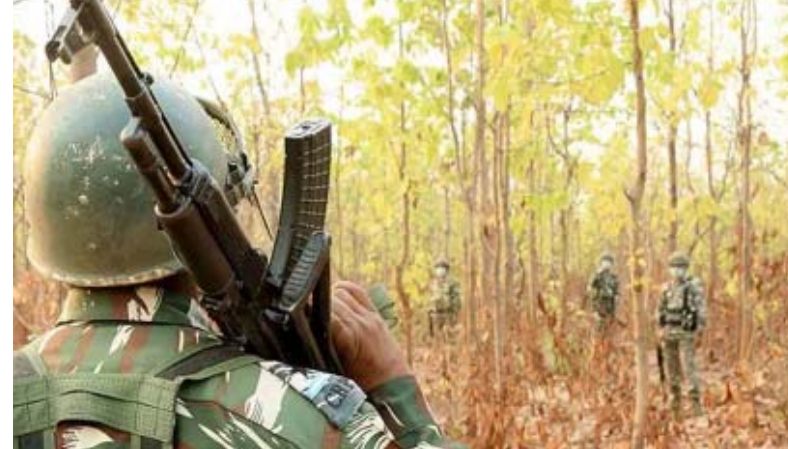
రాయ్ పూర్ : ఛత్తీస్ గఢ్ లో మరోసారి తుపాకులు గర్జించాయి. కాంకేర్ జిల్లా కల్పర్ అడవిలో జరిగిన ఎదురుకాల్పుల్లో తూటాల వర్షం కురిసింది. ఈ తూటాలకు 18 మంది మావోయిస్టులు మృతి చెందారు. ఎదురుకాల్పుల్లో బీఎస్ఎఫ్ ఇన్ స్పెక్టర్, ఇద్దరు జవాన్లకు తీవ్ర గాయాలయ్యాయి. చోటి బిడియా పోలీసు స్టేషన్ పరిధిలోని కల్పర్ అడవిలో పోలీసులు, మావోయిస్టుల మధ్య ఎదురుకాల్పులు ఇంకా కొనసాగుతున్నట్లు సమాచారం. ఘటనాస్థలి నుంచి ఏకీకృత తుపాకులు, ఇతర ఆయుధాలు, పేలుడు పదార్థాలను బలగాలు స్వాధీనం చేసుకున్నారు.