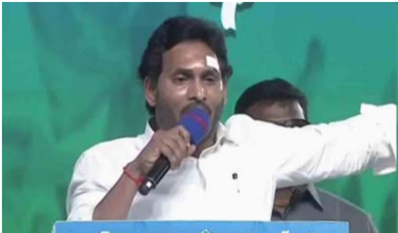
సంక్షేమానికి కృషి చేశామని వివరించారు. 14 ఏళ్ల పాటు ముఖ్యమంత్రిగా పనిచేసినా చంద్రబాబు పేదలకు మంచి చేసే పథకం ఏదీ అమలు చేయలేదని, సాధ్యం కాని హామీలు ఇస్తున్న వారిపై ఓటు వేసే ముందు జాగ్రత్తగా ఆలోచించి నిర్ణయం తీసుకోవాలని కోరారు.

అమరావతి : ఏపీలోని ప్రతిపక్ష నాయకులపై సీఎం వైఎస్ జగన్ మరోసారి తీవ్ర విమర్శలు చేశారు. ఎన్నికల ప్రచారంలో భాగంగా భీమవరంలో నిర్వహించిన మేముంత్తా సిద్ధం కార్యక్రమంలో మాట్లాడారు. కొంగ జవం చేస్తున్నావని చంద్రబాబు ను, పెళ్లిళ్ల వ్యవహారాన్ని పవన్ కల్యాణ్ ను ప్రశ్నించినందుకు తనపై కోపాన్ని పెంచుకున్నారని ఆరోపించారు. రాళ్ళు వేయండి.. అంతం చేయండిని పిలుపునిస్తున్నారని ఆరోపించారు. రాయ్ కు మోసం, బాబుకు మోసం పుట్టుకతో వచ్చినవని దుయ్యబట్టారు. ఏపీలో అమలవుతున్న సంక్షేమ , రైతు రాజ్యాన్ని చంద్రబాబు కూటమి అంతం చేయాలని చూస్తుందని ఆరోపించారు. పేదలకు మంచి చేయడం వల్ల ఓర్వలేక అన్ని పార్టీలు కలిసి ఒక్క జగన్ మీద దండయాత్రలు చేస్తున్నారని విమర్శించారు. ఐదేండ్లలో లంచాలు, వివక్ష లేకుండా 2.72 వేల కోట్ల సంక్షేమానికి ఖర్చుచేశామని తెలిపారు. అన్ని వర్గాల